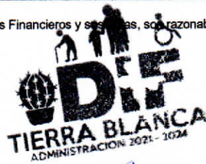
María Nereyda Sánchez García Elaboró

Sistema para el Desarrollo Integral de la Familia del Municipio de Tierra Blanca Guanajuato.