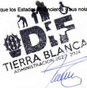
María Nereyda Sánchez García Elaboró

Sistema para el Desarrollo Integral de la Familia del Municipio de Tierra Blanca Guanajuato.