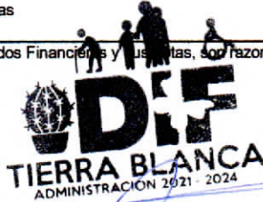
María Nereyda Sánchez García Elaboró

Sistema para el Desarrollo Integral de la Familia del Municipio de Tierra Blanca Guanajuato.