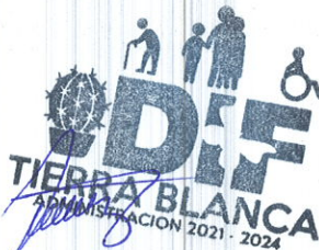
María Nereyda Sánchez García Elaboró

Sistema para el Desarrollo Integral de la Familia del Municipio de Tierra Blanca Guanajuato.